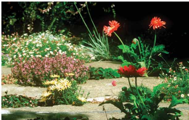
From certain vantage points the lines of plantings stack up to present a more densely planted experience