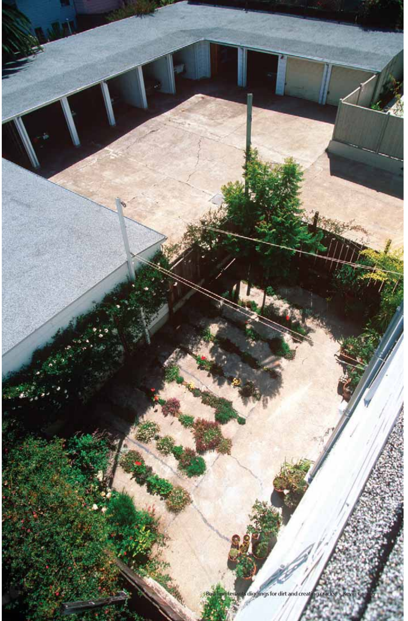
Building tenants diggings for dirt and creating cracks.