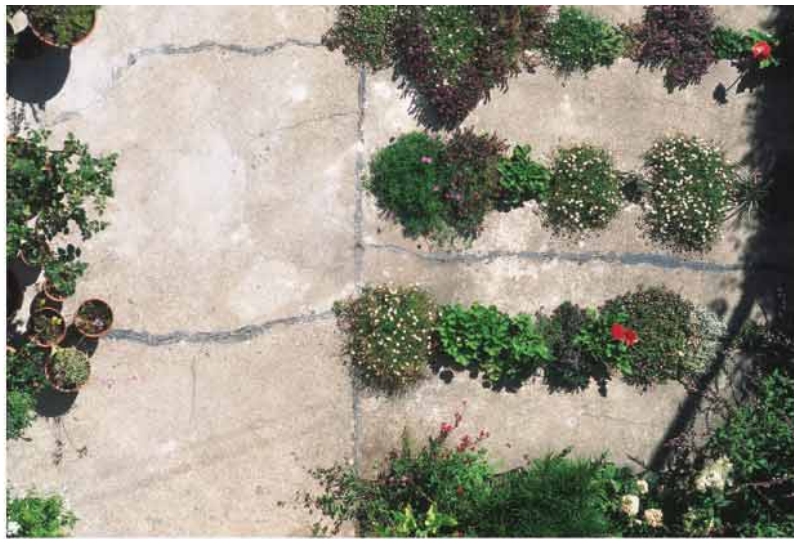
Detail: intervention, ©Tom Fox