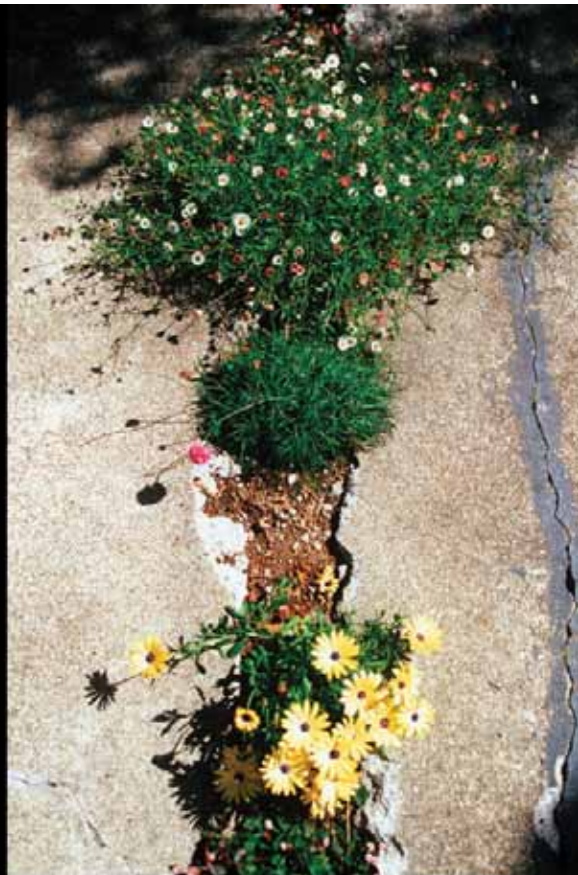
Cracking the concrete, © Kevin Conger